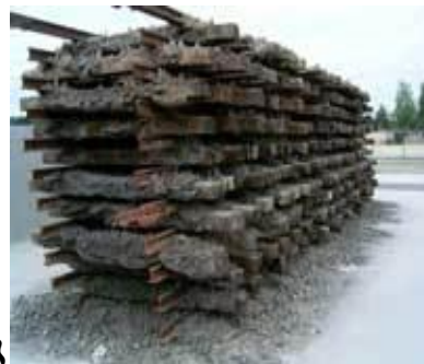
גריל לשרפת גופות במחנה בלז'ץ

יְתַגְדֵּל וְיִתְקַדֵּשׁ בּוֹרֵא הָעוֹלָם